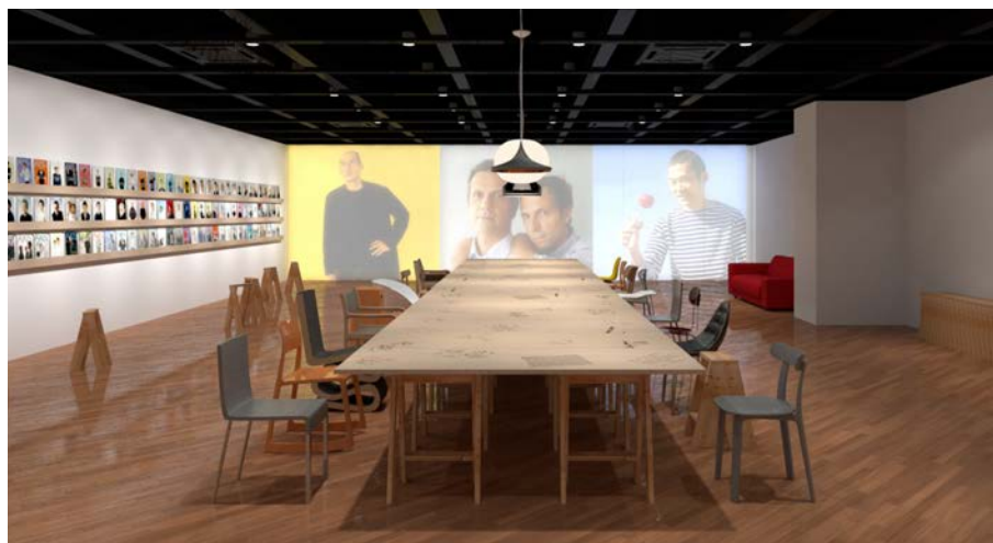
イメージ図 (トラフ建築設計事務所)

タイトル : 「AXIS THE COVER STORIES — 聞く・考える・話す、未来とデザイン」 会期 : 2018年11月1日(木) — 7日(水) 主催 : 株式会社アクシス 会場 : AXIS ギャラリー (AXISビル 4F)