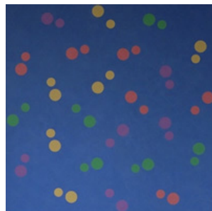
m791 puls 2013