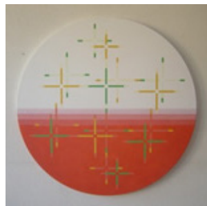
m722 kosmische gewebe- überlagernd -2 2006-07