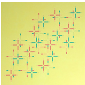
m688 my silk road 2005