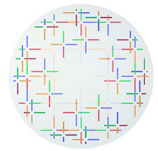
m433 kosmische gewebe - strahlend, 1997, sammlung: kunsthaus zürich