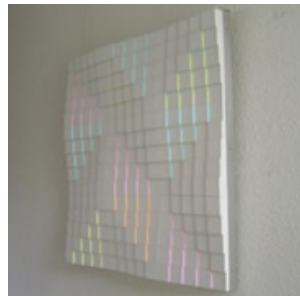
no.52 relief farbschatten ,75x75cm, 1978