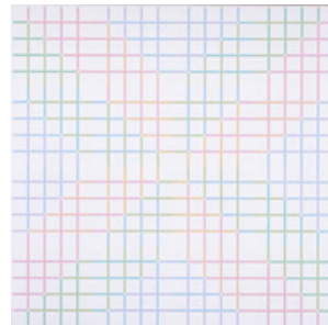
m215 fs/4x4 von 4 farben zur polyphonie 1986